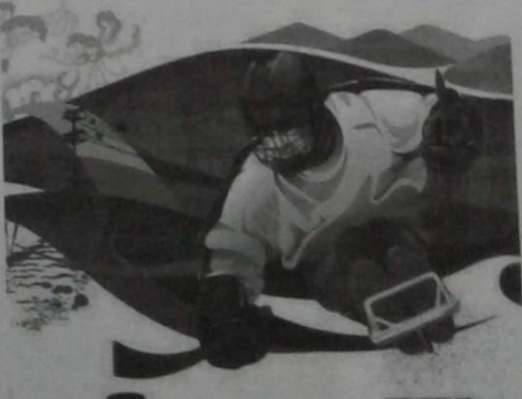
Бетті әзірлеген: Айгүл Молдаш, Павлодар қаласы №2 ЖОББМ-нің ұстазы

Абзал МАМЕТОВ, 4 «ә» гимназия сыныбының оқушысы