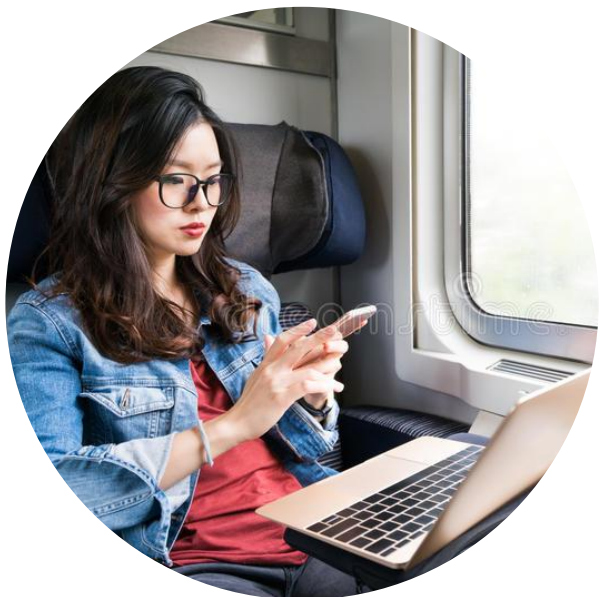
ПОЛЬЗОВАТЕЛЬ С БАЗОВЫМ УРОВНЕМ ЦИФРОВОЙ ГРАМОТНОСТИ

Знание и умение человека использовать информационно-коммуникационные технологии в повседневной и профессиональной деятельности