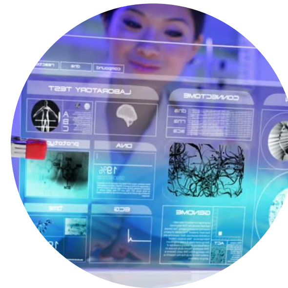
ПОЛЬЗОВАТЕЛЬ С ПРОФЕССИОНАЛЬНЫМ УРОВНЕМ ЦИФРОВОЙ ГРАМОТНОСТИ