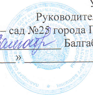
График работы консультативного пункта КГКП «Ясли – сада №25 города Павлодара»