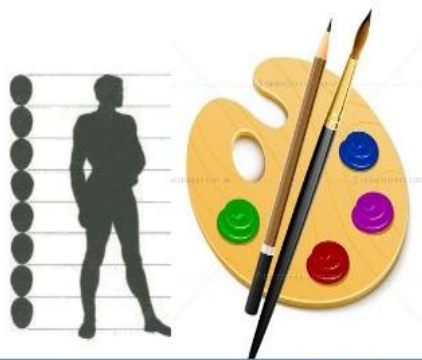
Человек - художественный образ