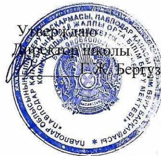
График проведения подготовки к МОДО с 28.10 по 01.11.2024г. (4 классы)