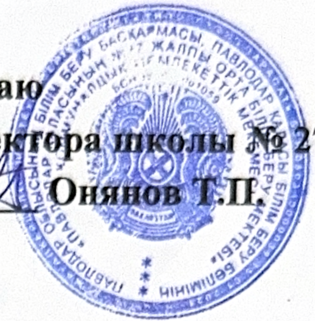
График дежурства учителей во время государственной итоговой аттестации